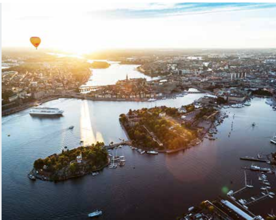
Vårt dricksvatten kommer från Mälaren och släpps ut i Östersjön, efter att vi använt och renat det.

MILJÖTIPS OCH INFORMATION FRÅN STOCKHOLM VATTEN OCH AVFALL FÖR DIG SOM BOR I CENTRALA STOCKHOLM • JUNI 2020