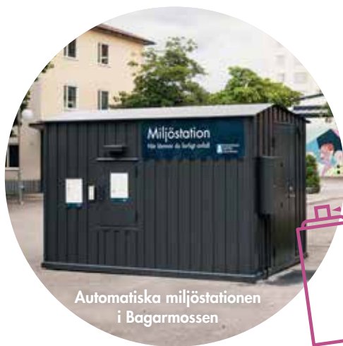
Automatiska miljöstationen i Bagarmossen