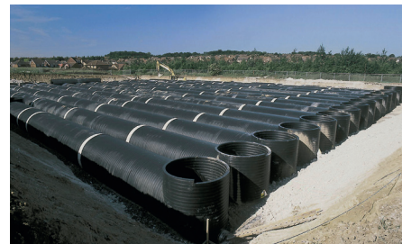
Avsättningsmagasin kan platsgjutats eller anläggas med hjälp av prefabricerade element. Ovan ett rörmagasin i plast.